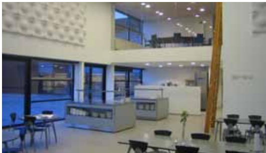
Datagraf, Auning, interiør i ny kantine

Vi ser frem til, at Datagraf fortsætter sin positive udvikling og glæder os til at medvirke ved yderligere udvidelser af selskabets smukke og præsentable domicil i Auning.