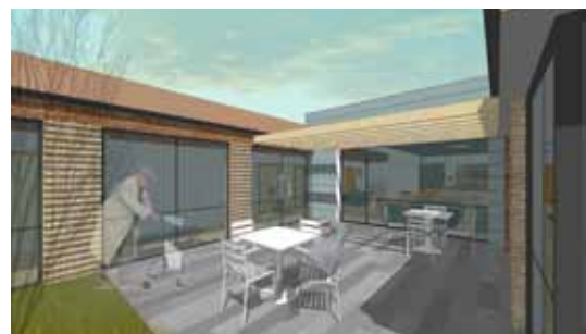
Vesterbo plejecenter, 40 boliger i Sønder sø

Dansk Boligbyg A/S er totalentreprenører og Sahl A/S er arkitekter på Vesterbos 40 nye plejeboliger, som opføres i 2009-2010.