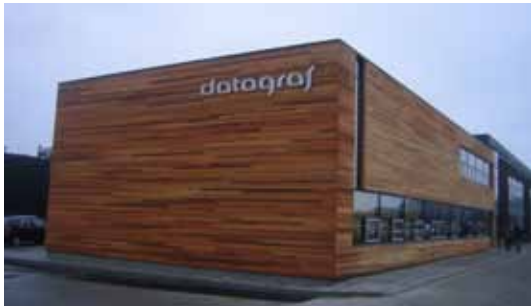
Datagraf, Auning, ny kantine

I andet halvår af 2008 har LB Consult været totalrådgiver på en 460 m 2 udvidelse med ny kantine, storkøkken, møderum og personalefaciliteter. Ørsted Murerforretning Jørgen Kusk A/S var hovedentreprenør og 3 x Nielsen var igen arkitekter på udvidelsen.