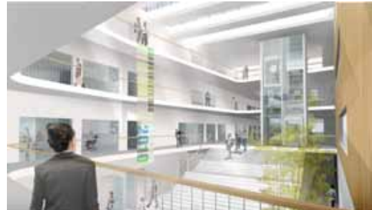
LandboMidtØst, nyt rådgivningscenter i Søften

LB Consults ydelser til det nye center omfatter projektering af alle installationer. Byggeriet opføres, med materialer og udførelse, så det overholder kravene i lavenergiklasse 2, hvilket var een af årsagerne til at opgaven blev vundet.