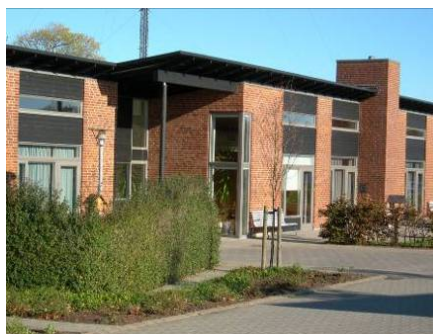
Udvidelse af plejehjem, Kollund

Bygherre: Aabenraa Kommune LB Consults ydelser: Bygherrerådgivning: Totalentreprisekonkurrence, indledende vurderinger, udbud, bedømmelse, kontrakt, projekterings- og udførelsesfase Areal: 600 m 2 Periode: 2006-2007