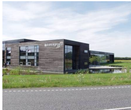
Udvidelse af Datagraf, Auning

Bygherre: Datagraf Ejendomme LB Consults ydelser: Bygherrerådgivning: Totalentreprisekonkurrence, indledende vurderinger, udbud, bedømmelse, kontrakt, Totalentreprenør: udførelse og aflevering E. Pihl & Søn med 3 x Nielsen Areal: 3000 m 2 Periode: 2003-2004