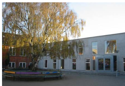
Øster Brønderslev Centralskole

Bygherre: Brønderslev Kommune LB Consults ydelser: Bygherrerådgivning: Totalentreprise, projekterings- og udførelsesfase Totalentreprenør: KPC BYG A/S med Arkitekterne Bjørk & Maigård Areal: 3600 m 2 Periode: 2004-2007