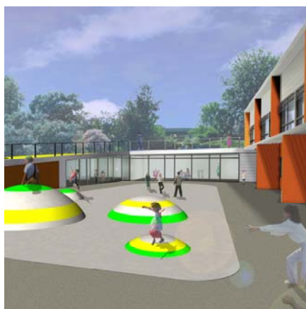
Udbygning af skole,, Aabenraa

Bygherre: Aabenraa Kommune LB Consults ydelser: Bygherrerådgivning: Totalentreprisekonkurrence, prækvalifikation, udbud, bedømmelse, kontrakt, projekterings- og udførelsesfase Totalentreprenør: MT Højgaard med Aaskov & Østergård A/S Arkitekter og Cowi Areal: 4350 m 2 tilbygning og renovering Periode: 2005-2008