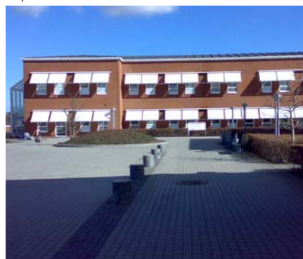
Nye isolationsstuer, Århus

Bygherre: Region Midtjylland LB Consults ydelser: Bygherrerådgivning: Totalrådgivningskonkurrence, indledende vurderinger, EU- udbud, bedømmelse og kontrakt Totalrådgiver: Cowi med Århus Arkitekterne Areal: 1100 m 2 Periode: 2006-2008