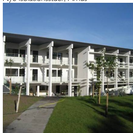
37 lejligheder, Ebeltoft

Bygherre: Hvide Hus, Ebeltoft A/S LB Consults ydelser: Bygherrerådgivning: Totalentreprisekonkurrence, indledende vurderinger, udbud, bedømmelse, kontrakt, projekterings- og udførelsesfase samt bygherretilsyn Entrepriseform: Fagentreprise Ingeniør: Moe & Brødsgaard A/S Arkitekt: Arkitema Areal: 5000 m 2 Periode: 2005-2007