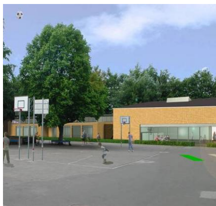
Udbygning af skole, Aabenraa

Bygherre: Aabenraa Kommune LB Consults ydelser: Bygherrerådgivning: Totalentreprisekonkurrence, prækvalifikation, udbud, bedømmelse, kontrakt, projekterings- og udførelsesfase Totalentreprenør: MT Højgaard med Aaskov & Østergård A/S Arkitekter og Cowi Areal: 3300 m 2 tilbygning og renovering Periode: 2005-2008